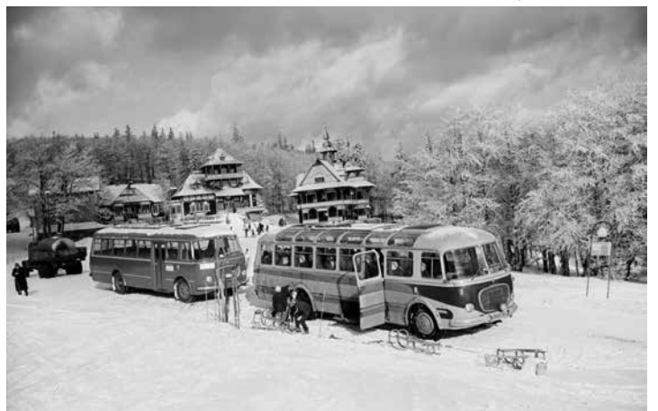
Autobus Škoda RTO „LUX“