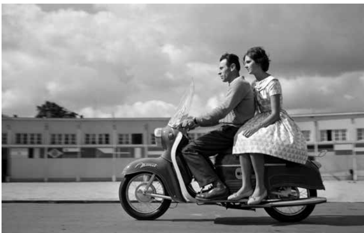
JAWA Manet S 100